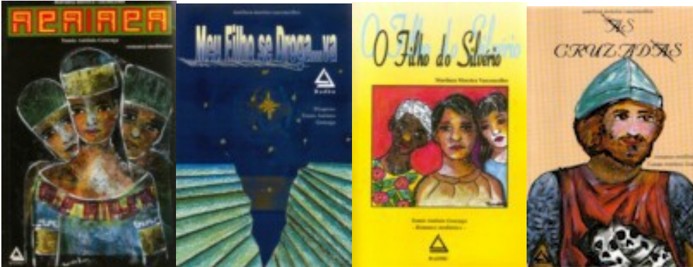
11 - Acaiaca